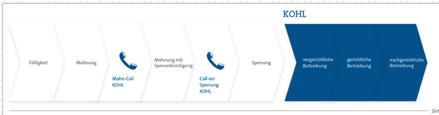
Abb. 1: Mahnprozess Energieversorgungsunternehmen

Die KOHL GmbH & Co. KG (KOHL) ist ein inhabergeführtes mittelständisches Unternehmen in der dritten Generation und seit 1968 im Bereich der Forderungsbeitreibung tätig. Langjährige Erfahrungen und ein Personalstamm von 75 Mitarbeitern gewährleisten den Mandanten aus dem Bereich Energieversorgung, Kabelnetzbetreibern, Banken und Fitnessstudios höchstmögliche Beitreibungsquoten und schnellstmöglichen Zahlungseingang. 80 Prozent der Kunden vertrauen und profitieren seit über 10 Jahren von der Dienstleistungsqualität von KOHL.